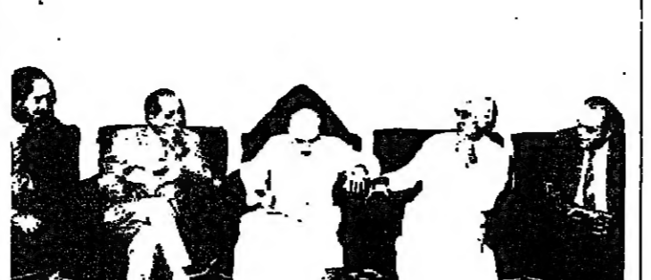
وفد الجبهة اللبنانية في زيارة صفي وبيدو المطران ابو جوده